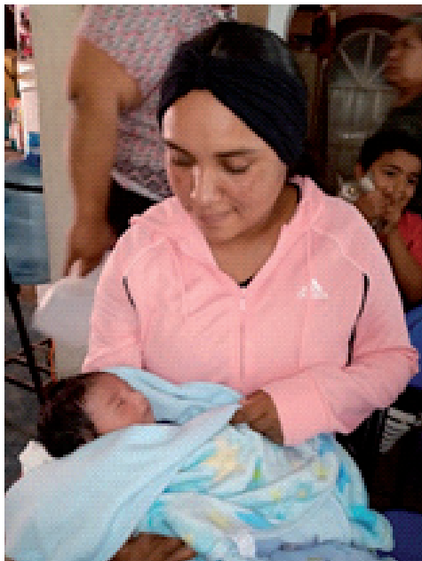
Nyeste skud på stammen i kirken

Jesus svarede, at mens Han nu var hos dem, ville de ikke faste, hvorved Han vel indikerede, at det ville kunne de, når Han tog hjem til sin Far. Og Jesus fastede også 40 dage i ørkenen – det var der, Satan kom og fristede Ham.